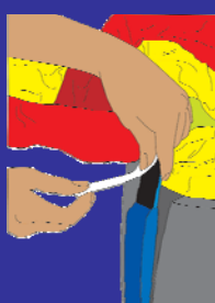
Changement de visuel facile