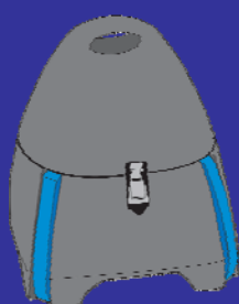
Pratique et facilement transportable

Ce n'est pas du luxe de pouvoir compter sur L'ORIGINAL