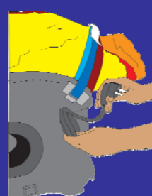
Gonflage en moins d'une minute