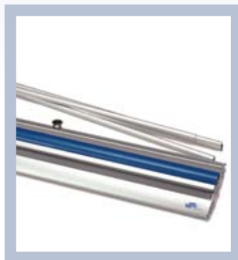
Placez la tige de support dans la cassette et tirez sur l'illustration – c'est tout!