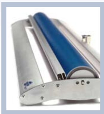
La cassette est légère, élégante et fonctionnelle.

Roll Up Promotion est une version simplifiée de Roll Up, c'est le système qui s'impose pour l'affichage ponctuel d'un seul et même message. Idéal si vous avez besoin de supports multiples, par exemple lors d'une campagne de lancement ou d'un événement particulier. Dimensions: 80x200 cm, livré dans un emballage de transport robuste.