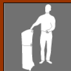
Container rotomoulé exclusif