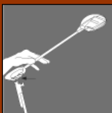
Glissez les spots sur les barres magnétiques